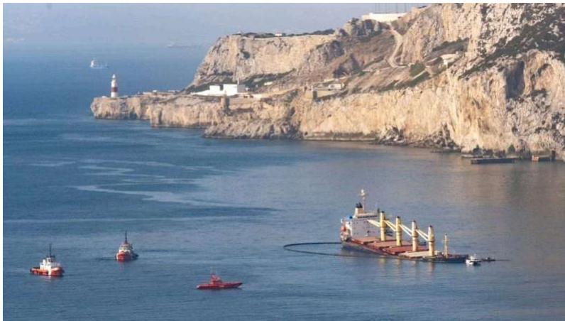
© In 2022 botste het bulkschip OS 35 op de Adam LNG-tanker voor de kust van Gibraltar. Foto: John Gomez / Shutterstock

Voor olieverontreiniging met fossiele brandstof zijn er de Civil Liability Convention en de Bunkers Convention om een theoretische en conventionele compensatie te bepalen bij een ongeluk. Doorgaans draait de scheepseigenaar op voor de kosten als er iets mis gaat en is hij zich verplicht tegen deze schade te overwinnen.